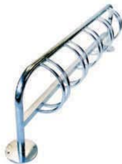
Cod. Portabici Serie