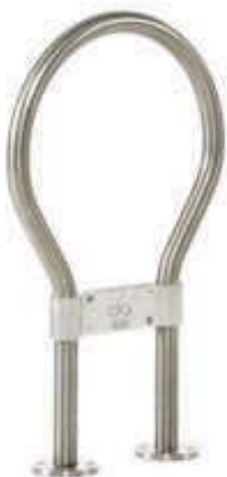
Cod. Portabici Clip