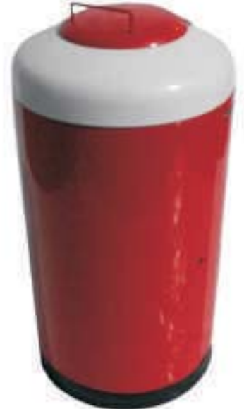
Cod. Farmaci 201