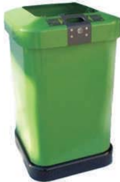
Cod. Duomo 202